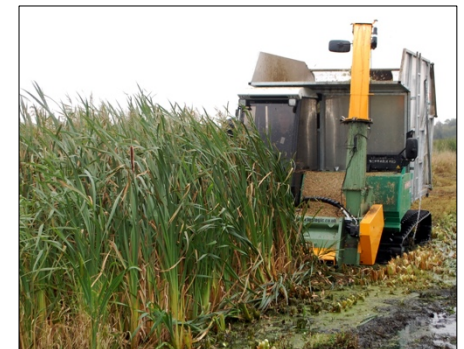
3N Kompetenzzentrum e.V.